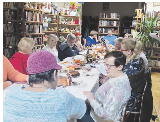
Wieczór kolęd i pastorałek w filii bibliotecznej w Podwilczu