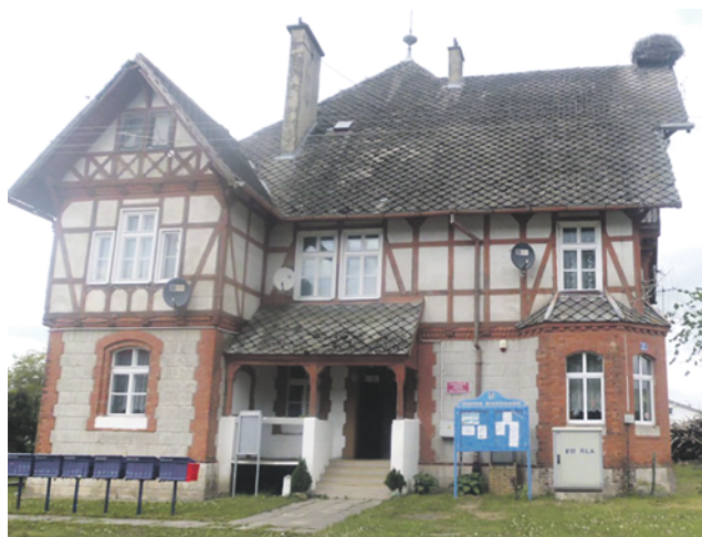
Budynek filii bibliotecznej w Podwilczu