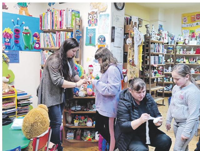
Bezpieczne ferie w filii bibliotecznej w Podwilczu